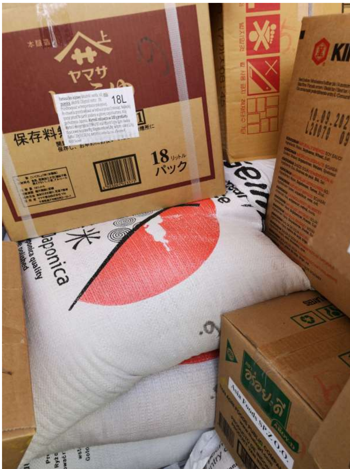
Preprava potravín pri nevyhovujúcich hygienických podmienkach - tovar (ryža) nahádzaný priamo na podlahe.