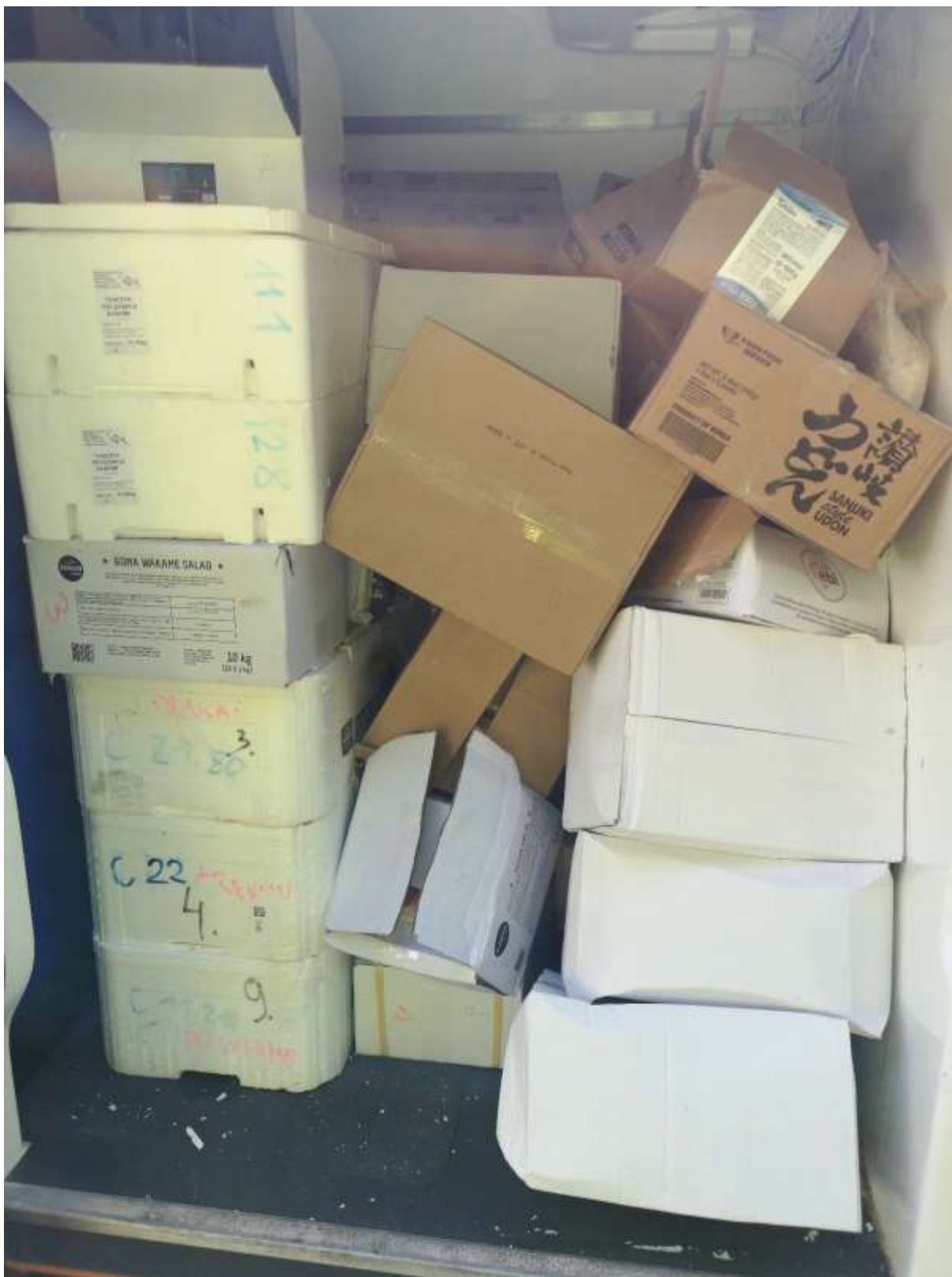
Preprava potravín pri nevyhovujúcich hygienických podmienkach.