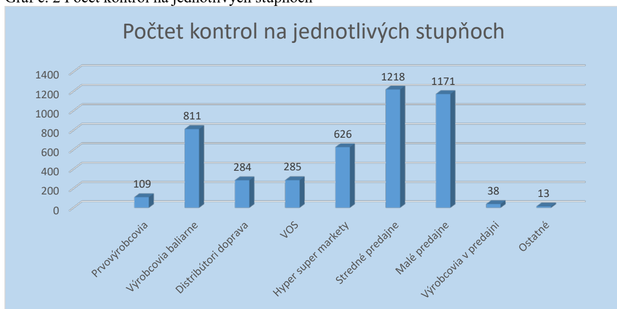
Graf č. 2 Počet kontrol na jednotlivých stupňoch

Z celkového počtu kontrol 4 555 bolo najviac úradných kontrol v mesiaci vykonaných v stredných predajniach 1 218 (26,7 %), potom nasledujú malé predajne 1 171 (25,7 %) a výrobcovia, baliarne 811 kontrol (17,8 %).