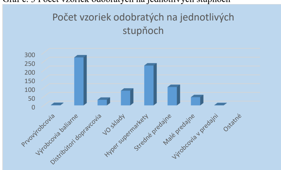
Graf č. 3 Počet vzoriek odobratých na jednotlivých stupňoch