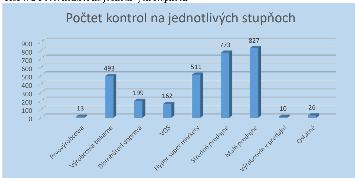
Graf č. 2 Počet kontrol na jednotlivých stupňoch

Z celkového počtu kontrol 3 014 bolo najviac úradných kontrol v mesiaci vykonaných v malých predajniach 827 (27,4 %), potom nasledujú stredné predajne 773 (25,6 %) a hyper a supermarkety 511 kontrol (16,9 %).