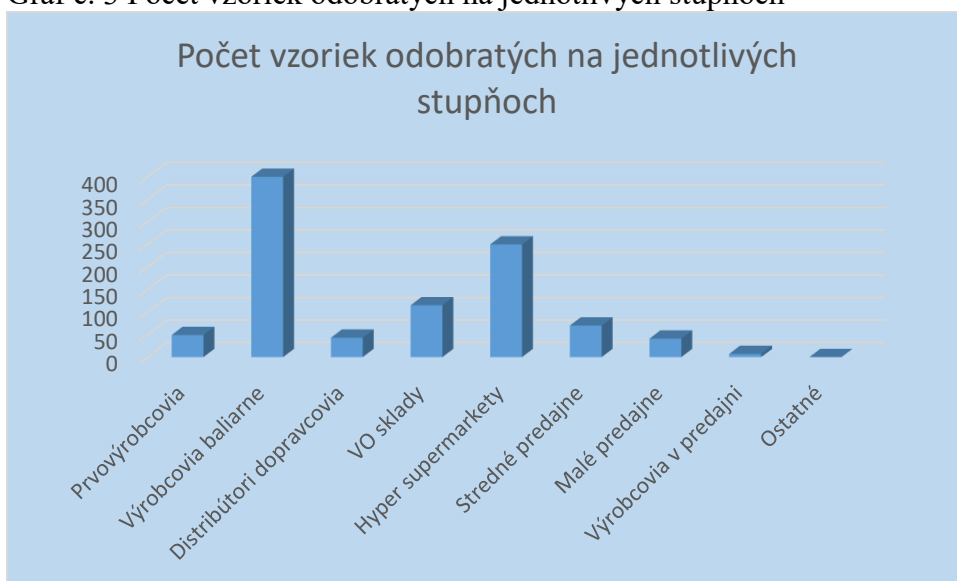
Graf č. 3 Počet vzoriek odobratých na jednotlivých stupňoch