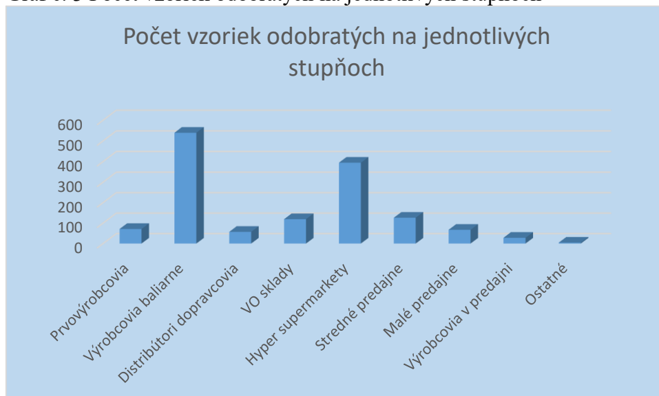
Graf č. 3 Počet vzoriek odobratých na jednotlivých stupňoch