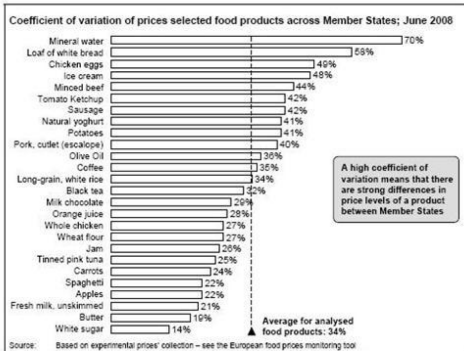
Figure 2: Dispersion of price levels for selected products across Member States

Obchodné praktiky ako sú obmedzenia teritoriálne smerovaných dodávok alebo prekážky stavané paralelnému obchodu predstavujú ďalšiu kľúčovú bariéru pre integráciu EÚ trhov. Záujmové skupiny si sťažujú na takéto praktiky, ktoré sú nezlučiteľné s princípmi vnútorného trhu Spoločenstva. Typickým príkladom sú maloobchodníci istej krajiny, ktorí sú “nútení” nakupovať miestne pri obchodovaní s medzinárodnými dodávateľmi, čo vyvoláva prekážky v medzinárodnom obchode. S veľkou pravdepodobnosťou takéto praktiky narušia fungovanie vnútorného trhu Spoločenstva a mohli by negatívne ovplyvniť spotrebiteľov kvôli vyšším cenám a užšiemu sortimentu výrobkov.