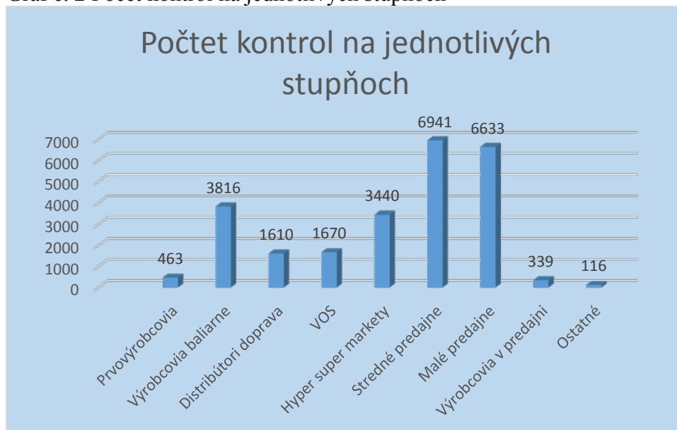
Graf č. 2 Počet kontrol na jednotlivých stupňoch

Z celkového počtu kontrol 25 027 bolo najviac úradných kontrol v mesiaci vykonaných v stredných predajniach 6 941 (27,7 %), potom nasledujú malé predajne 6 632 (26,5 %) a výrobcovia 3 816 kontrol (15,2 %).