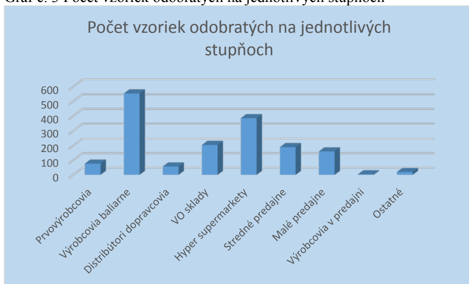
Graf č. 3 Počet vzoriek odobratých na jednotlivých stupňoch