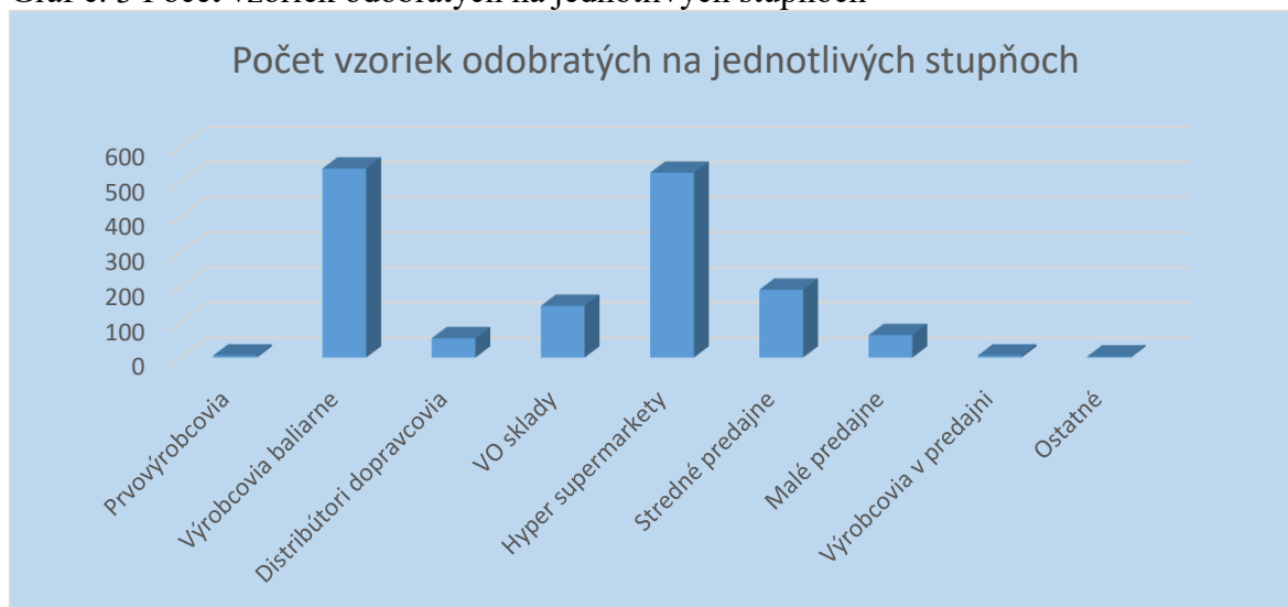
Graf č. 3 Počet vzoriek odobratých na jednotlivých stupňoch