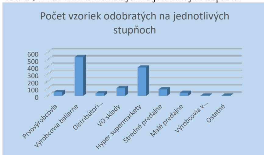
Graf č. 3 Počet vzoriek odobratých na jednotlivých stupňoch