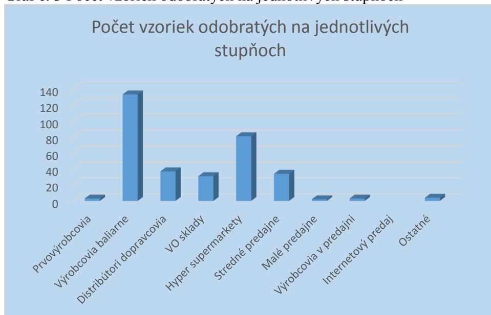
Graf č. 3 Počet vzoriek odobratých na jednotlivých stupňoch