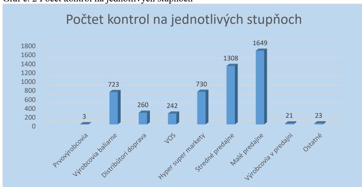
Graf č. 2 Počet kontrol na jednotlivých stupňoch

Z celkového počtu kontrol 4 959 bolo najviac úradných kontrol v mesiaci vykonaných v malých predajniach 1 649 (33,3 %), potom nasledujú stredné predajne 1 308 (26,4 %) a hyper a supermarkety 730 kontrol (14,7 %).