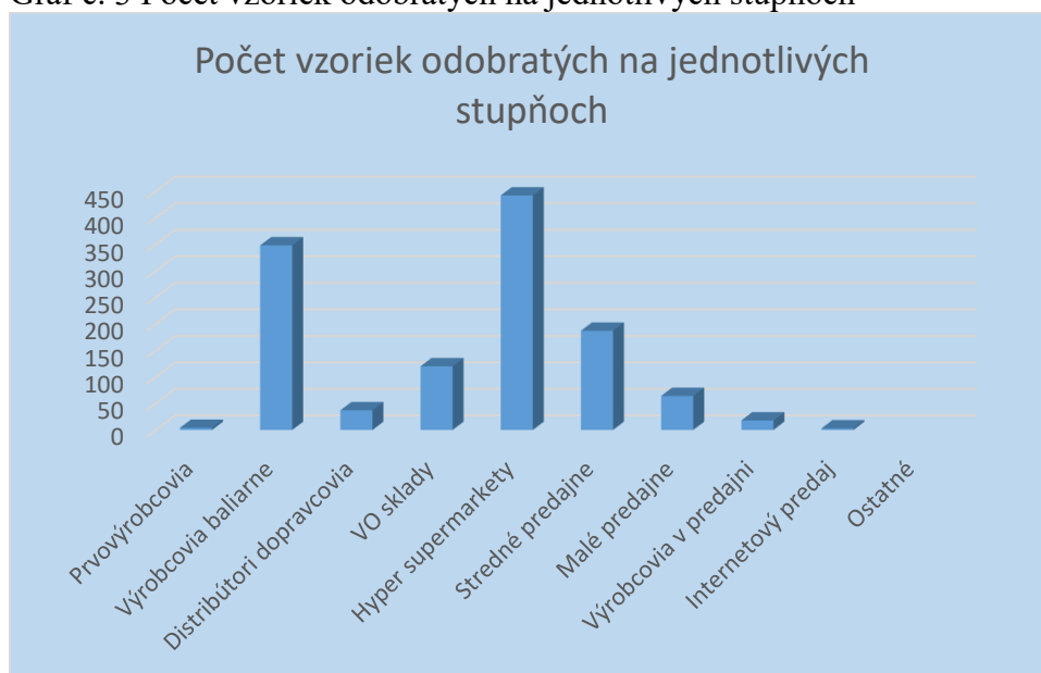
Graf č. 3 Počet vzoriek odobratých na jednotlivých stupňoch