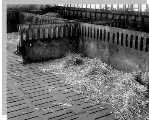
Slama na čiastočne roštovej podlahe

Pre ciciaky dobre fungujú aj spracovaná rašelina a mäkké materiály, ako napríklad sisalové povrazy, konopné laná alebo jutové vrecia. Sú lákavé aj pre odstavčatá, ako aj všetky ostatné kategórie ošípaných; treba ich však starostlivo usporiadať tak, aby ošípaná nemohla odtrhnúť veľké kusy, ktoré by mohli spadnúť cez rošt a preniknúť do systému na odvod kalu.