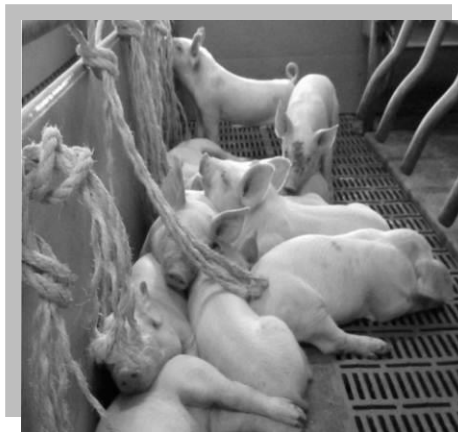
Povraz z prírodných materiálov

Pre ciciaky dobre fungujú aj spracovaná rašelina a mäkké materiály, ako napríklad sisalové povrazy, konopné laná alebo jutové vrecia. Sú lákavé aj pre odstavčatá, ako aj všetky ostatné kategórie ošípaných; treba ich však starostlivo usporiadať tak, aby ošípaná nemohla odtrhnúť veľké kusy, ktoré by mohli spadnúť cez rošt a preniknúť do systému na odvod kalu.